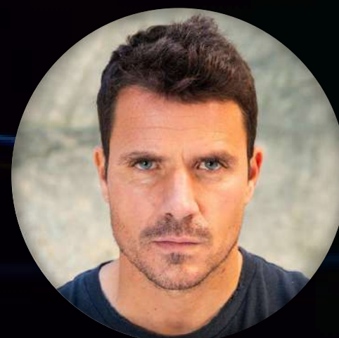
DANI MARTÍN POR CONFIRMAR